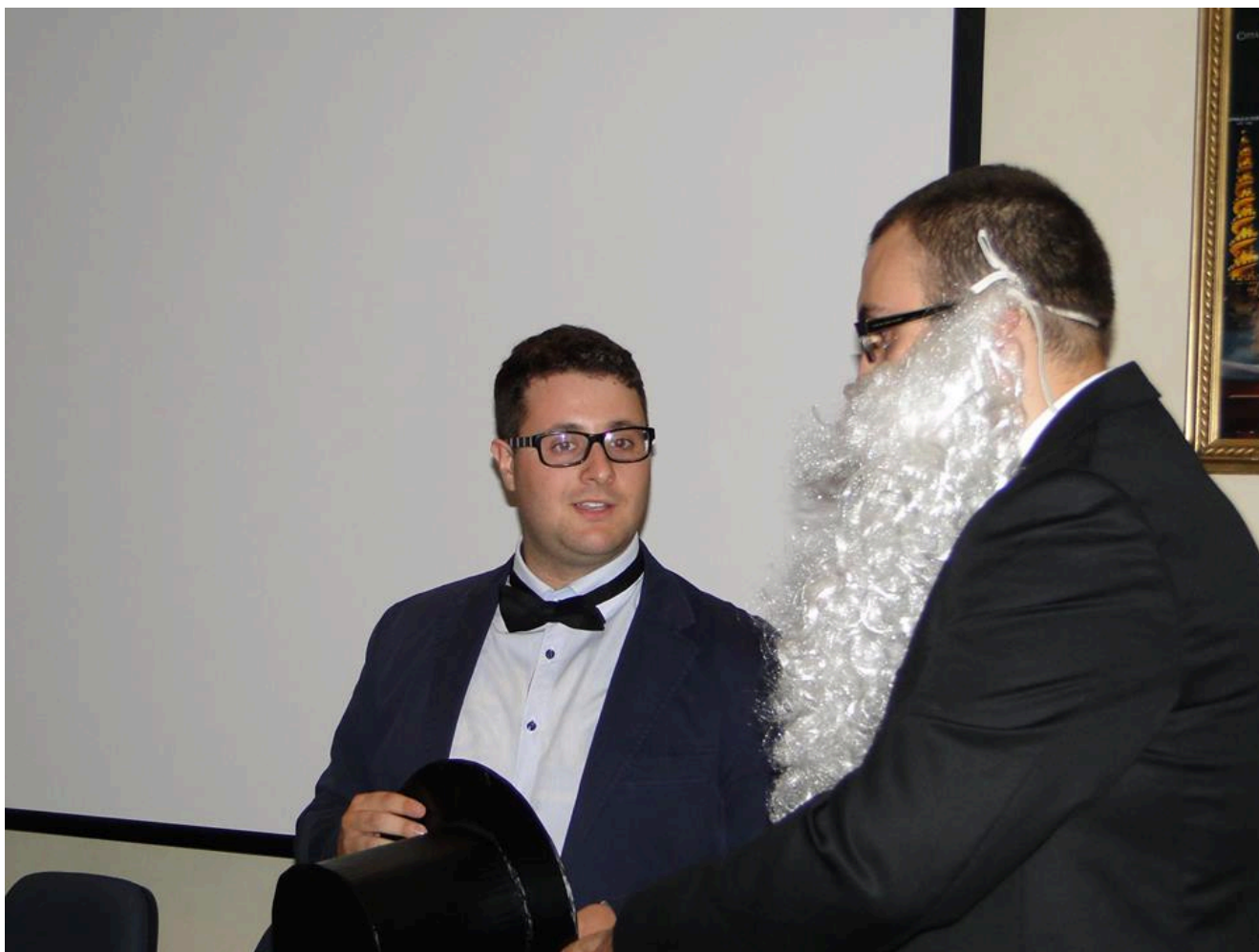
Fani e Acquaderni in chiave moderna

Raccogliendo l'invito fatto dalla presidente dell'AC di Viterbo, siamo ritornati alle origini, partendo dai valori che hanno caratterizzato l'impegno di Fani e Acquaderni: Preghiera, Azione e Sacrificio (con l'aggiunta poi della Formazione).