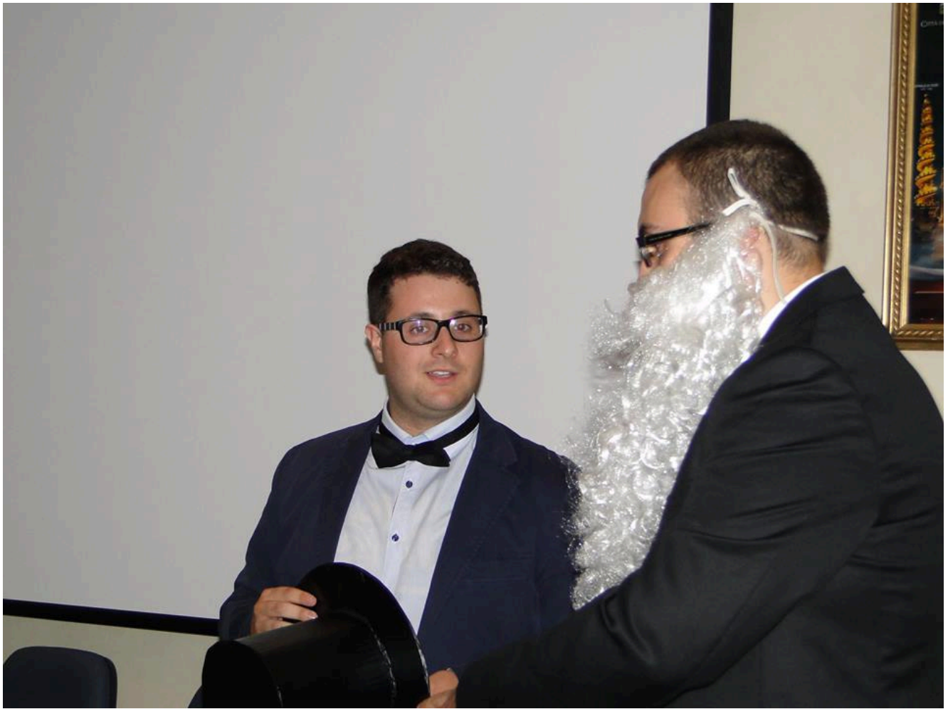
Fani e Acquaderni in chiave moderna