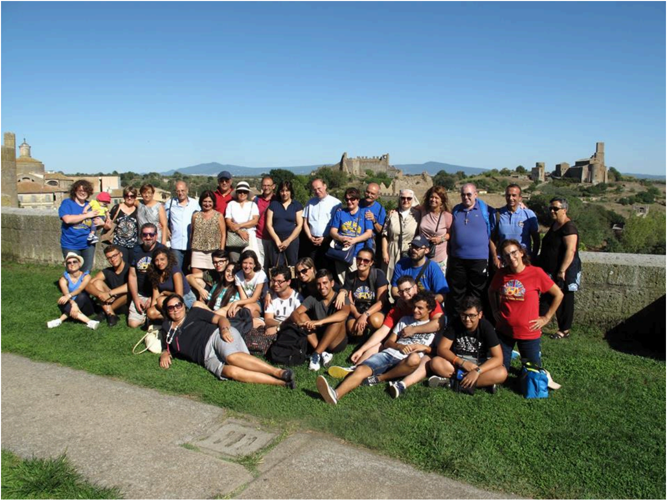
AC Diocesana in visita a Tuscania

Un'esperienza forte, arricchita dalle testimonianze di un giovane e di un adulto, riguardanti quello che è l'impegno che tutti noi dobbiamo avere all'interno della comunità in cui viviamo (politica, vita sociale, vita laicale etc.) perchè è con la nostra testimonianza e il nostro impegno che possiamo far capire a tutti quanto è bella la FAMIGLIA dell'AC.